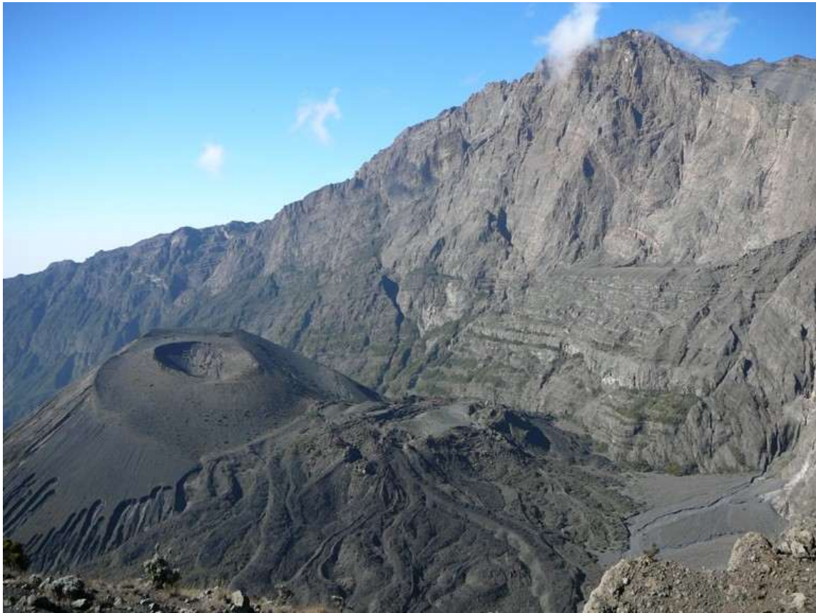
Mt Meru: kráter ze sopečného popela a utuhlé lávové toky