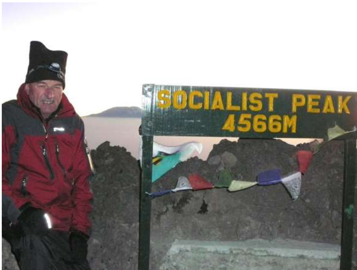
Na Mount Meru

Není důležité zúčastnit, ale zvítězit se!