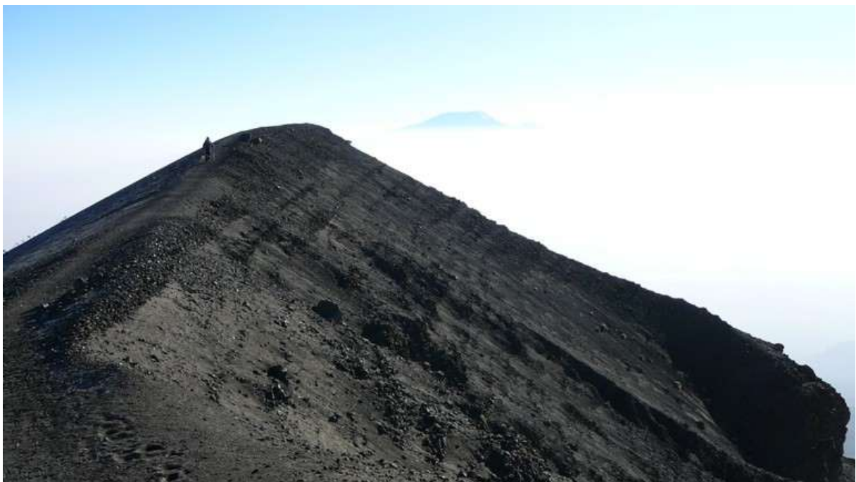
Dolů z Mt Meru; v zadu nad mraky vrchol Kilimanžára