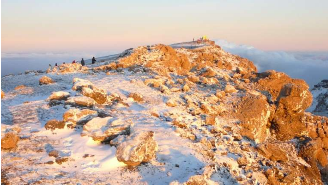
Vrchol Kili po východu slunce