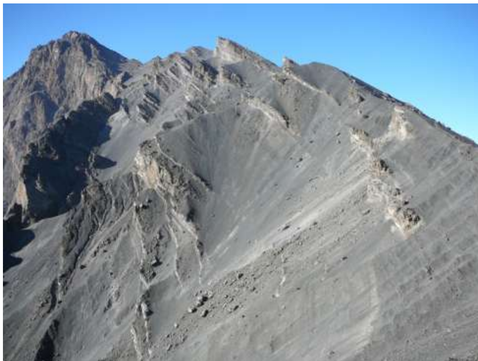
Dolů z Mt Meru

V neděli ráno v 9 h jsme vyrazili autem k nástupu na aklimatizační výstup na Mt Meru 4.566 m. Cestou jsme ve spřátelené cestovce nafasovali spacáky, my kteří jsme si nevešli vlastní, průvodce po kopcích, bylo jich 9, z cestovky. Začali jsme v pravé poledne při cca 30 °C ve výšce 1.500 m. Ještě jsem si přibalil spacák a 3 litry vody. Procházeli jsme prašnou cestou, jen tak v kraťasech a tryčku mezi zebrami, bůvolů, žirafami. Poslední dvě žirafy jsme potkali na cestě asi ve 2.000 m. Ten den jsme po 5½ hodinách končili na chatě ve výšce 2.500 m. Na první den to bylo dost. Slunce zapadlo kolem půl sedmé a před devátou každý vypil svůj regenerační nápoj a spal.